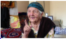
Фарғона тонг отгунча... Томоша қилиш 17:45