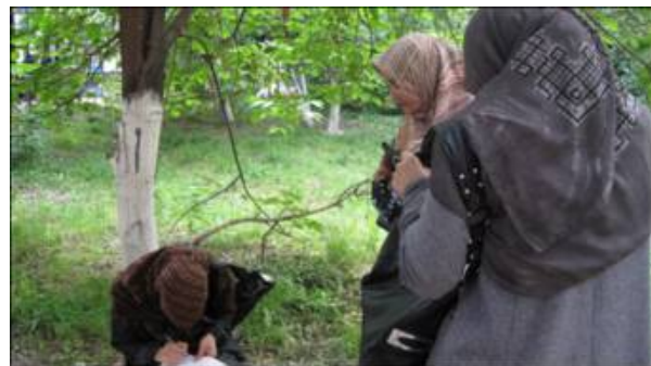
АСАТ Қозоғистон маҳбусларнинг яқинларига товон тўлаши кераклигини айтади

Ватанида диндорлиги учун таъқиб қилинганини айтган 29 нафар ўзбекистонлик бошпана изловчилар 2010 йил июнида Алма -Ота полицияси