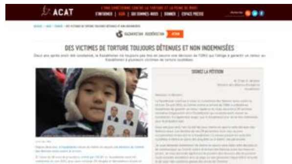
АСАТ Қозоғистонни қийноқларга шерикликда айблади