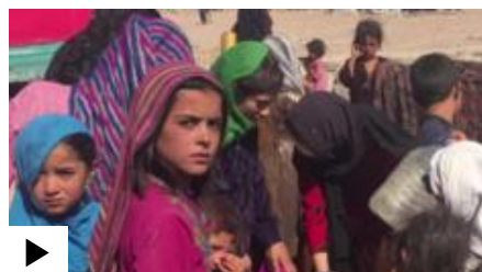
6 iyul kungi dastur