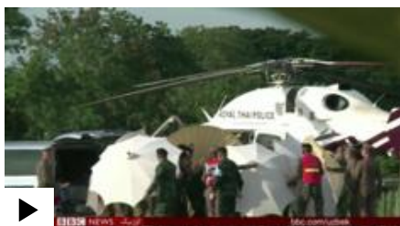
Bi-bi-si O'zbek Xizmatining televizion dasturi