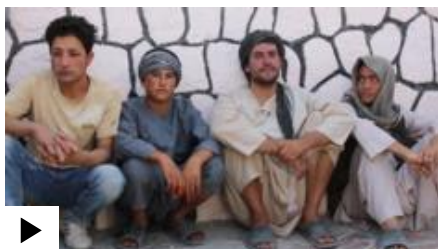
Bi-bi-si O'zbek Xizmati televizion yangiliklar dasturi