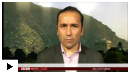
Bi-bi-si O'zbek Xizmati televizion yangiliklar dasturi