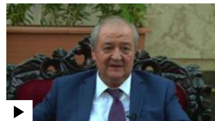
Bi-bi-si O'zbek Xizmati 10 iyul kungi televizion yangiliklar dasturi