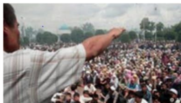
Площадь Бобура в Андижане, 13 мая 2005 года

Один из свидетелей, который сейчас вместе с семьей находится за пределами Узбекистана, работал в андижанском морге с сентября 2005 года по февраль 2006 года. Он также является очевидцем событий на площади Бобура. "23 сентября 2005 года следователь службы национальной безопасности (СНБ) Узбекистана заставил меня подписать бумагу, в которой говорилось, что меня направляют в областную больницу Андижана на добровольные работы. С этого момента я становился внештатным сотрудником СНБ", - приводится в докладе рассказ свидетеля.