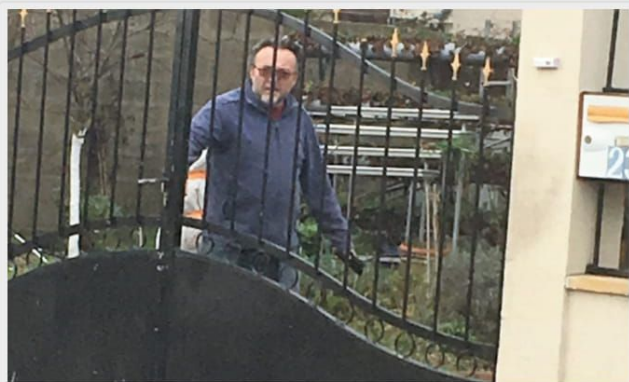
Якобы адвокат Умиджона Абдуназарова во Франции

Когда очередь говорить дошла до правозащитницы, то она сказала, что ей неприятно, когда на ложных основаниях получают убежище, подрывая тем самым доверие к настоящим беженцам, которые действительно нуждаются в помощи.